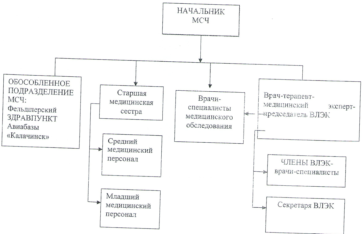
Схема организационной структуры медико-санитарной части с функциями ВЛЭК